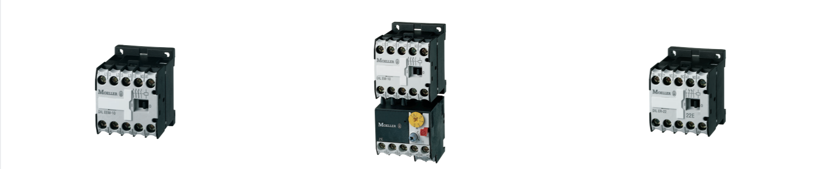
Ministrykače DILEM 4 kW Nadproudové relé ZE Pomocný stykač DILER