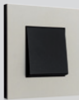
159 Natural soft grey