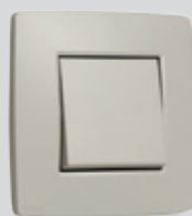
102 Light grey