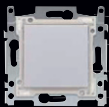
2. Kryt přístroje chrání svorky před dotykem 230V