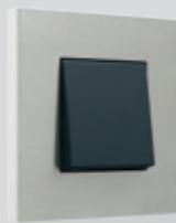
250 Stainless steel on white