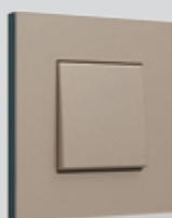
157 Champagne steel