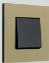
160 Natural green