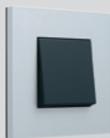
155 Alu grey

Série Pure spojuje moderní materiály s ostrými liniemi a nabízí nepřeberné možnosti kombinací rámečků a středových krytů pro náročnější klienty. Kouzlo řady tkví v exkluzivních materiálech, jako je bambus nebo ušlechtilé kovy.