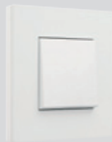
154 White steel