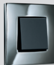
128 Dark silver