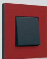
152 Natural red