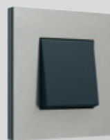
150 Stainless steel on anthracite