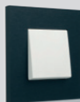
158 Alu black