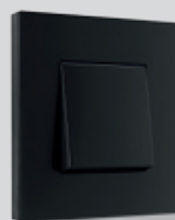
161 Black steel