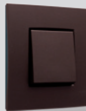
124 Dark brown