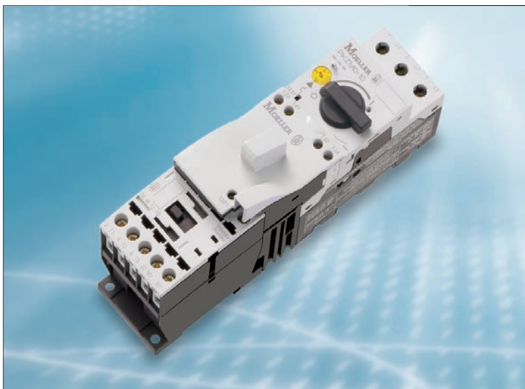
Obr. 1. Spouštěčové kombinace MSC

Nové spouštěčové kombinace sestavené ze standardních přístrojů jsou k dispozici ve čtyřech typových velikostech. Stykač a motorový spouštěč mají stejnou kompaktní šířku. Spouštěčové kombinace MSC používající technologii beznástrojových zásuvných hřebenu jsou k dispozici do jmenovité hodnoty 15,5 A. Kompletní propojovací sady jsou nabízeny pro spouštěčové kombinace a reverzační spouštěčové kombinace do 32 A.