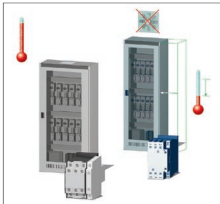
Obr. 6. Úspora místa snižuje náklady na rozváděč

Stykače se stejnosměrným ovládacím napětím od 17 do 65 A mají přídržný výkon jen 0,5 W a stykače do 150 A pouze 2 W. Výsledkem je menší spotřeba energie pro celou instalaci, možnost použít menší rozváděč a úspora nákladů na ventilátor.