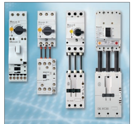
Obr. 3. Nové spouštěčové kombinace ze standardních přístrojů šetří místo