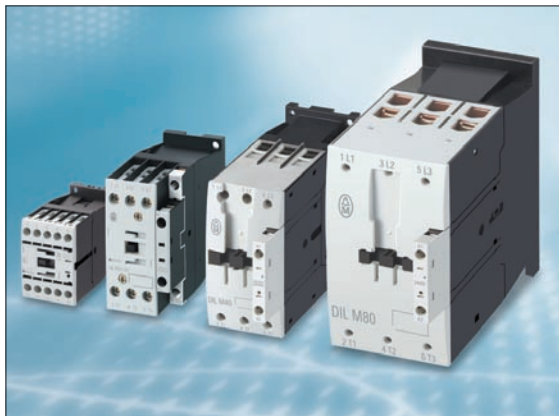
Obr. 4. Nově vyvinuté stykače DILM