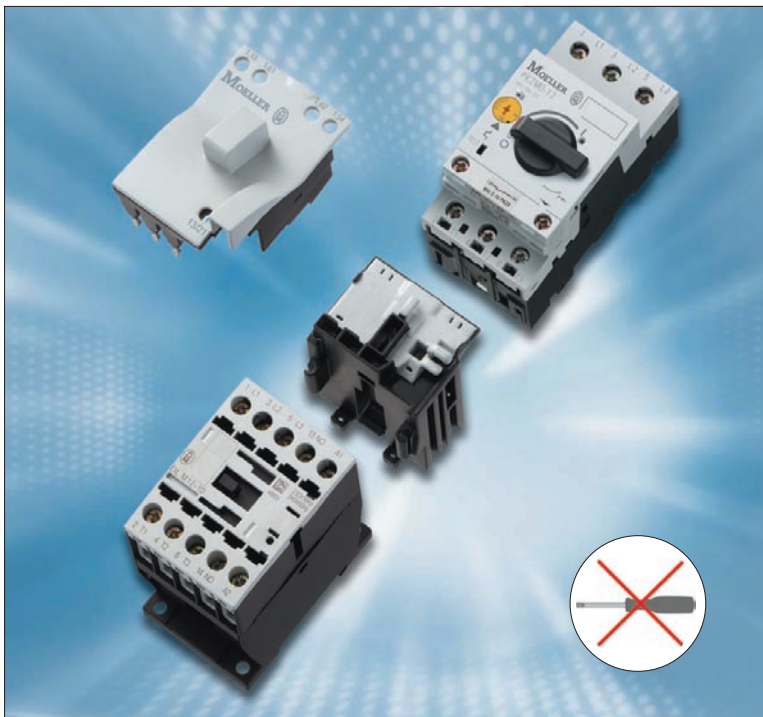
Obr. 2. Spojení bez nástrojů