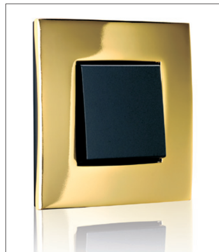
Obr. 3. Design Intense Gold

Designová řada Intense s plastovými rámečky v šesti barvách dodá interiéru díky svému střízlivému stylu příjemnou atmosféru (obr. 3). Ti, co preferují přírod-