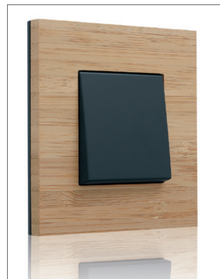
Obr. 4. Design Pure Bambus

Pro náročnější klienty je inspirující série Pure, jejíž výhradně přírodní materiály jako bambus a korozivzdorná ocel zaručí trvalou a elegantní povrchovou úpravu přístrojů (obr. 4, obr. 5). Navíc díky svým netypickým ostrým tvarům zajistí mimořádnou eleganci interiéru. Je dostupná celkem s rámečky v jedenácti variantách a se středovými kryty ve dvanácti barvách.