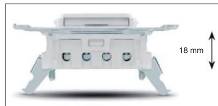
Obr. 9. Malá montážní hloubka vypínače

stejnou osovou vzdáleností 71 mm. To dovoluje rozhodnutí ohledně osazení instalační krabice ve vodorovné či svislé poloze nechat v podstatě na poslední chvíli.