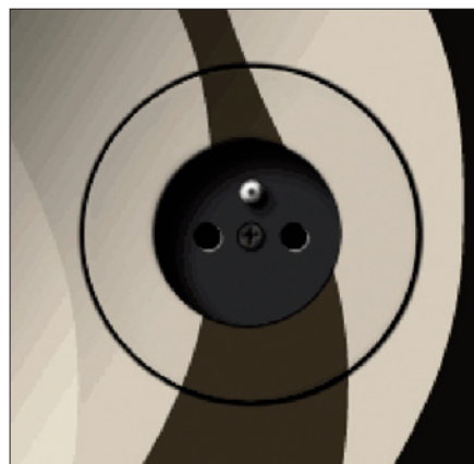
Obr. 6. Zásuvka Mysterious zapuštěná v sádkartonu

tivní omyvatelnou tapetou. Jeho umístění prozradí jen vnější mezikružší přístroje prosvětlené modrými diodami LED uvnitř tlačítka. Jeden ze čtyř beznapěťových kontaktů, který vybaví např. binární vstup systému Nikobus, radiofrekvenční nebo impulzní relé, se aktivuje dotykem libovolného místa na tlačítku. To je bezesporu další přednost přístroje Mysterious.