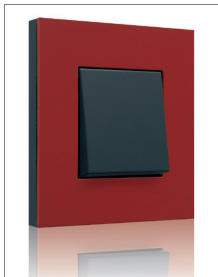
Obr. 5. Design Pure Natural red

Milovníky extravagance a originálního designu osloví převratná novinka v podobě neviditelného bezrámečkového vypínače Mysterious. Přístroj je zcela zapuštěn do sádkartonové nebo cihlové stěny a barevně sladěn s osobitým interiérem. Dokonale splyne s motivem na zdi přemalováním nebo přelepením dekora-