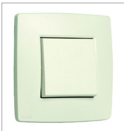
Obr. 2. Design Original White

Diskrétní, ale přitom nadčasová je řada Original (obr. 2), jež je charakteristická svými mimořádně jemnými liniemi. Mo-