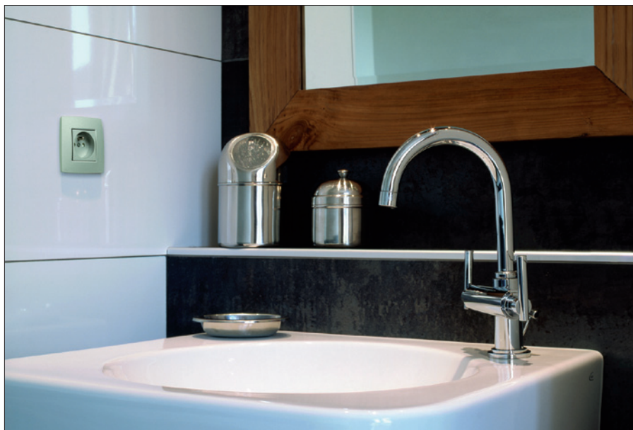
Obr. 1. Interiérový design Original

dely jsou k dispozici od klasické bílé až po tlumené pastelové barvy: krémovou, stříbrnou, hnědou nebo světle šedou. Příjemně překvapí cenou v kombinaci s kvalitním provedením. Oproti starší řadě PR20 je vypínač v bílé barvě přibližně o 20 % levnější.